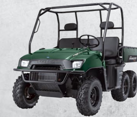
RANGER 700 6x6 COULEURS: ●●

CAPACITÉS ÉNORMES. TRACTION HORS NORMES. IL N'EXISTE PAS PLUS PUISSANT QUE LE RANGER. Équipés du puissant moteur 700 cc bicylindre à injection électronique, le RANGER XP E et le RANGER 6x6 offrent un couple important et donc des capacités de franchissement et de travail hors normes. Aucun véhicule concurrent ne peut rivaliser avec les 795 kg de capacité de traction, ou encore les 455 kg (RANGER XP E) et 568 kg (RANGER 6x6) de capacités de benne. Le confort légendaire des suspensions arrière indépendantes et la banquette 3 places viennent couronner le tout.