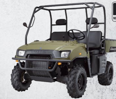
RANGER 700 XP E COULEURS: ●●