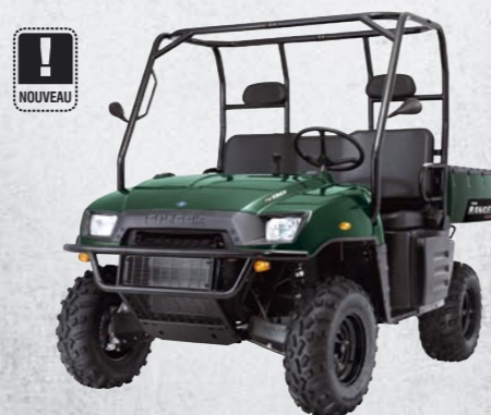
RANGER 500 4x4 E